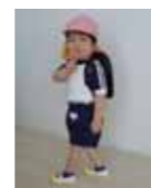
「初登園!!」 深草 潤