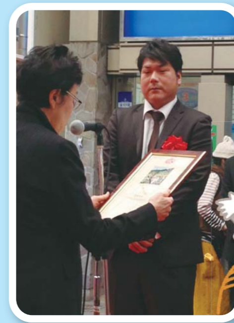
長崎市浜町ベルナード観光通りにて表彰式が行われました。